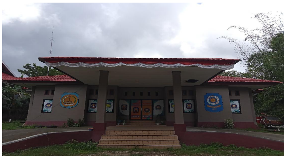
Gambar 1 Satpol PP, Damkar dan Penyelamatan